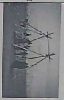
3-слайд. Наурыз кйже.

Балалар, қоянмен қолтастыңдар, әрі қарай жүрсіміз.